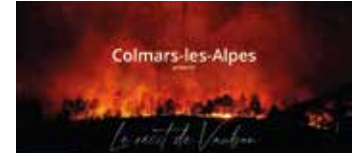
Teaser de l'exposition. Fearless.