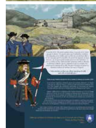
Couverture et 4e de couverture de la publication. Illustrations Alex David (Creat-in).