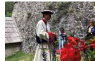
Je suis en garnison à Colmars en 1694.