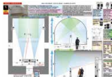
Plan technique du projet. Fearless.