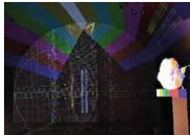
Réglages mapping des murs et de la voûte.