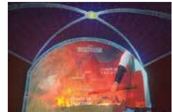
La frontière entre Allos et Colmars...