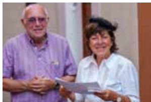
Suivez-moi, en silence !