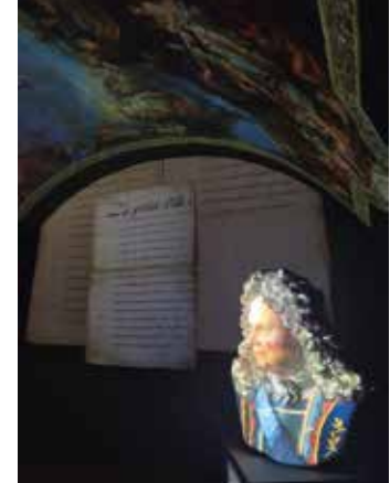
« Réveil » de la sculpture de Vauban.

En 2023, un travail sera mené afin d'améliorer la signalétique urbaine du site, encore non opérationnelle.