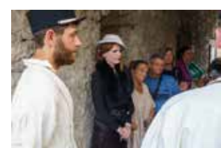
Ce capitaine a un charme fou !