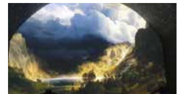
Colmars, pays de montagnes.