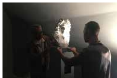
Soclage du buste de Vauban.