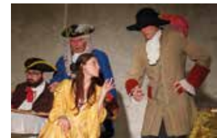
Gosier sans fond que vous êtes !