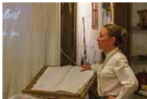
Prenez vos plumes et écrivez la phrase de morale d'aujourd'hui.