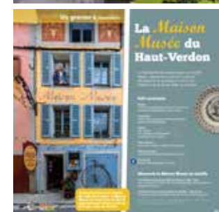
Documentation d'appel - offres culturelles de Colmars. 16 pages.