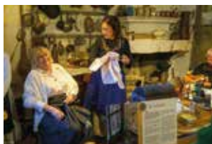
J'arrive de Champ Richard, je suis toute escagassée ! J'ai pris des fromages pour le Café des Alpes.