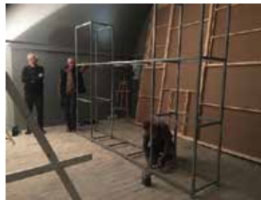
Conception de la cimaise destinée à recevoir la technique.