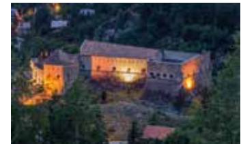
Fort de Savoie par R. Palomba.