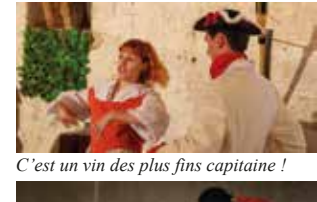
C'est un vin des plus fins capitaine !