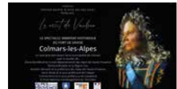
Fin du teaser et financeurs.