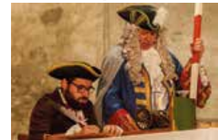
Notez Thomassin !