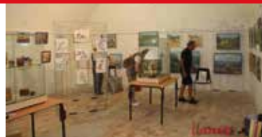
Salle 2 du fort avant travaux. Exposition temporaire.

La phase 2 de valorisation du Fort se voulait être un projet original et accessible aux familles, un projet visant à se positionner avec force vis-à-vis de l'ensemble des offres culturelles du territoire de la CCAPV.