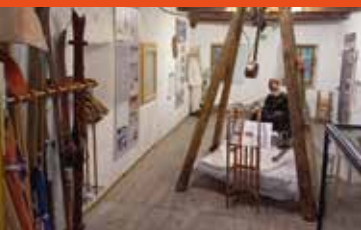
Histoire du ski - Tour Dauphine