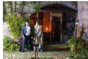
« Mais plus important monsieur le maire, il nous faut... un contrat ! »