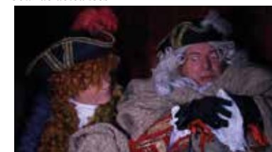
La visite de Vauban - 1692