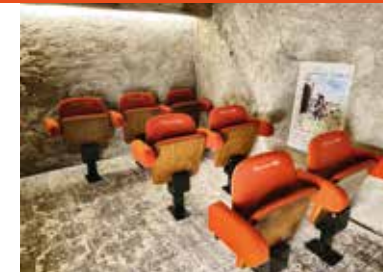
La salle de projection - 1er étage de la Tour

Le village fait face à une surpopulation de soldats envoyés à l'hôpital due aux entraînements intensifs du capitaine du Puy. Le consul décide alors de le convoquer afin de le raisonner.