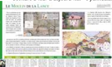
Panneau du moulin de la Lance