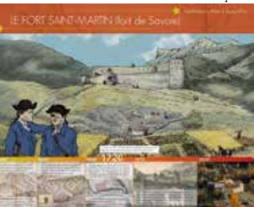
Colmars d'hier à aujourd'hui - 8 panneaux