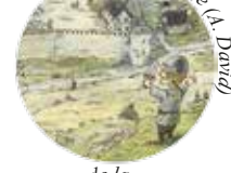
Colmars au Moyen Age (A. Dard)