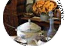
Cuisine de la maison bourgeoise