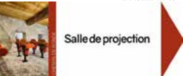
Fléchage Parcours de visite