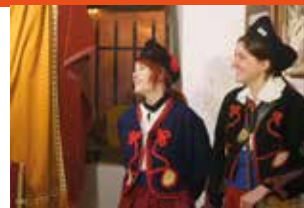
« Vous savez il n'en est pas un d'Allos à Thorame, qui ne lui tire son chapeau, même d'aussi loin qu'il pourrait l'apercevoir ! »