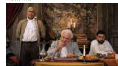
Jour de doléances