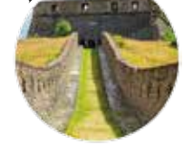
La redoute de France