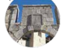
La porte de France