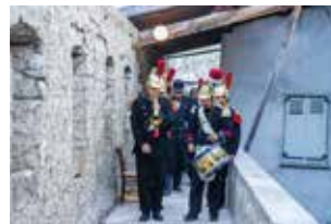
Au son du tambour et du clairon dans le chemin de ronde.