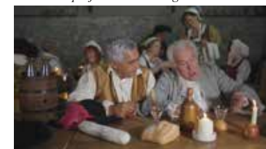
Le régiment de Vaubécourt